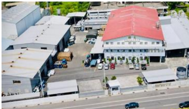
(Lianyou Metals 社全景)