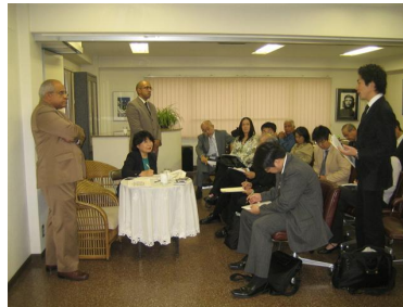
会見後の質疑に丁寧に応対する キューバ大使