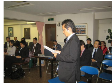
ニッケルについて質問する筆者

キューバは独立以来、米国から度重なる圧力と経済封鎖を受け続けており、その被害は人